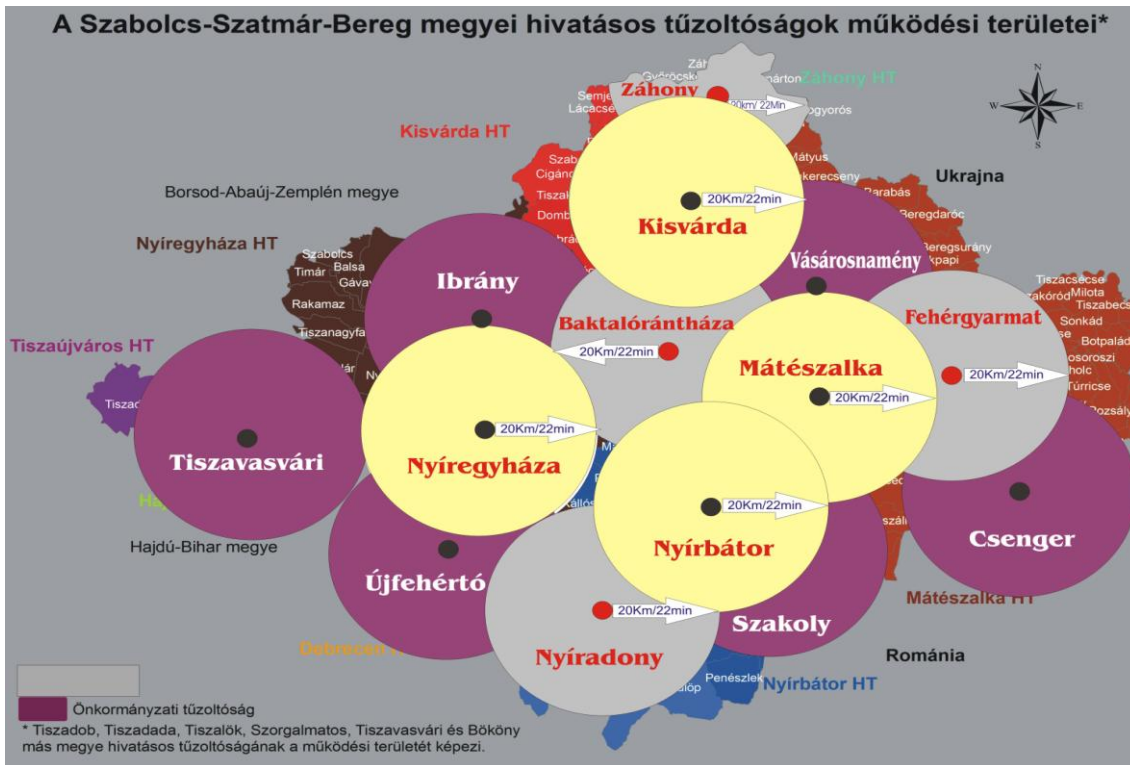
2. ábra. Szabolcs Szatmár Bereg Megye tűzvédelmi lefedettsége Önkormányzati tűzoltóságokkal (saját)

képesek tűz és káresetnél fél vagy egy teljes rajjal egyaránt képesek beavatkozásra. A kell szót azért használtam, mert ezek a parancsnokságok törvényi keretek között vállalták műveleti körzetükben a kárelhárítást. A forrást számukra jelenleg az önkormányzatok és az állam adja az Országos Katasztrófavédelmi Főigazgatóság útján, szigorú havi elszámolási kötelezettséggel. Az önkormányzati tűzoltóságok támogatása egyébként differenciált, vagyis minél fehérebb folton található a tűzoltóság, annál nagyobb forrást biztosítanak működéséhez.