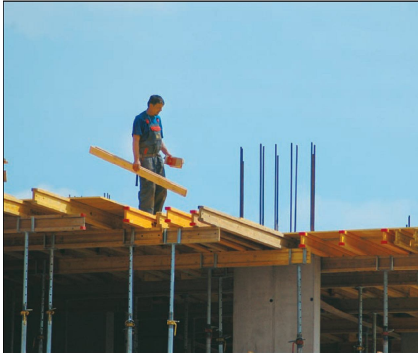
3. ábra. Egyéni védőeszköz nélküli munkavégzés 3

Az építőipar az a terület, ahol a munkavállalók nagyon gyakran végzik munkájukat más munkaterületen. Az iparág jellemzője az ideiglenes munkahelyi környezet, és a változó munkahely. Ezért a jó munkaszervezésnek igen nagy a jelentősége. A változó munkahely mellett a munkavállalókat a változó hőmérséklet is komolyan sújtja. Gondoljunk a nyári melegben, téli hidegben, esőben, hóban végzett munkára.