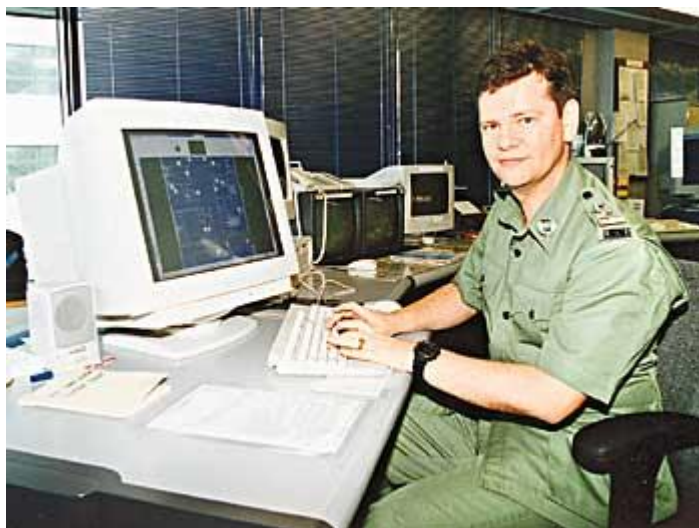
1. ábra Hong kong reptéri rendőrség vezénylő szobája [3]

Az informatika robbanásszerű fejlődésével természetesen a számítógépek is teret nyertek azokban a helyiségekben, melyekben a tevékenységirányítás zajlott. Kezdetben az adatbázisok gyors kereshetősége illetve a szöveges leírások hatékony rögzítése adott okot a használatukra (1. ábra).