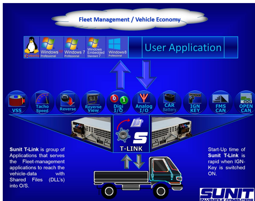
4. ábra Gépjárműbe tervezett számítógép szolgáltatásai [15]