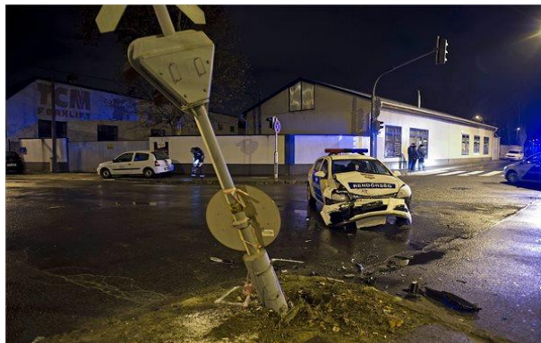
2. ábra. Rendőrségi jármű balesete [4]

Nagyot ugorva az időben, de maradva a rendvédelmi szerveknél, 2016. január 16-án egy rendőrautó és egy másik személygépkocsi ütközött össze egy budapesti útkereszteződésben. A balesetről részleteket nem közöltek, így nem lehet egyértelműen megállapítani melyik gépkocsivezető hibázott. Az összetört járórautóból azonban látszik, hogy az ütközés nagy erejű volt, az anyagi kár is jelentős. Az ütközés ereje arra utal, hogy nagyobb sebességgel következhetett be a karambol. Igaz, hogy az útburkolat nedves volt, ilyenkor a fékút hossza is megnövekszik, amennyiben vészfékezésre kerül sor, de vélhetően a vészfékezés nem, vagy csak nagyon későn következett be. Feltételezhető, hogy a megkülönböztető jelzést használó jármű vezetője is hibázhatott, hiszen valószínűleg nem győződött meg kellőképpen az elsőbbségadás biztosításáról mielőtt behajtott volna a forgalmi jelzőlámpával biztosított útkereszteződésbe. Természetesen, ha a baleset másik résztvevője tilos jelzés ellenére hajtott a kereszteződésbe (vagy esetleg nem volt járművezetésre alkalmas állapotban), abban az esetben a felelősség teljes mértékben a szabálytalan magatartást tanúsító járművezetőt terheli.[4]