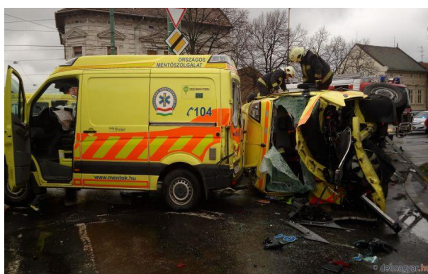
4. ábra. OMSZ mentő-gépkocsik balesete [6]

Egészen hihetetlen, de 2016. március 01-én pedig két szirénázó mentőautó ütközött össze Szegeden egy útkereszteződésben. Az ütközés következtében a két mentő totálkárosra tört, az egyik fel is borult. A baleset helyszínéről négy mentőst szállítottak kórházba kollégáik. A képeket látva még szerencsének is mondható, hogy ennél nagyobb baj nem történt. A baj azonban így is nagy, hiszen ilyenkor derül ki, mekkora problémát jelent az életmentő jármű és személyzetének hiánya. Az is nagyon szomorú, hogy a járművek már a korszerű, modern flotta részét képezték és szinte még újak voltak. Az anyagi kár óriási, egy ilyen mentőgépkocsi ára a húsz millió forintot is elérheti. A diagnózis egyértelmű, a gépkocsivezetők figyelmetlensége közel negyven millió forintba került. Érhetetlen, hogy nem hallották egymás szirénáját, de valószínűleg a túlzott magabiztosság is közrejátszott a balesetben. Elképzelhető, hogy abszolút nem voltak felkészülve (nem számítottak rá), hogy ha kevés is, de megvan az esélye annak, hogy megkülönböztető jelzését használó járművek egyszerre érkezzenek egy útkereszteződéshez.[6]