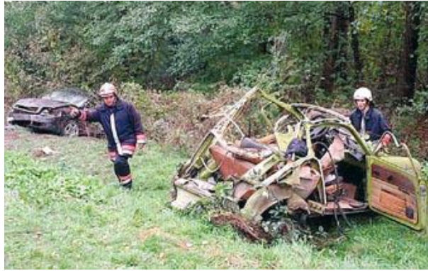
1. ábra. Kormányzati autó balesete Ordacsehinél [3]

Nagyot ugorva az időben, de maradva a rendvédelmi szerveknél, 2016. január 16-án egy rendőrautó és egy másik személygépkocsi ütközött össze egy budapesti útkereszteződésben. A balesetről részleteket nem közöltek, így nem lehet egyértelműen megállapítani melyik gépkocsivezető hibázott. Az összetört járórautóból azonban látszik, hogy az ütközés nagy erejű volt, az anyagi kár is jelentős. Az ütközés ereje arra utal, hogy nagyobb sebességgel következhetett be a karambol. Igaz, hogy az útburkolat nedves volt, ilyenkor a fékút hossza is megnövekszik, amennyiben vészfékezésre kerül sor, de vélhetően a vészfékezés nem, vagy csak nagyon későn következett be. Feltételezhető, hogy a megkülönböztető jelzést használó jármű vezetője is hibázhatott, hiszen valószínűleg nem győződött meg kellőképpen az elsőbbségadás biztosításáról mielőtt behajtott volna a forgalmi jelzőlámpával biztosított útkereszteződésbe. Természetesen, ha a baleset másik résztvevője tilos jelzés ellenére hajtott a kereszteződésbe (vagy esetleg nem volt járművezetésre alkalmas állapotban), abban az esetben a felelősség teljes mértékben a szabálytalan magatartást tanúsító járművezetőt terheli.[4]