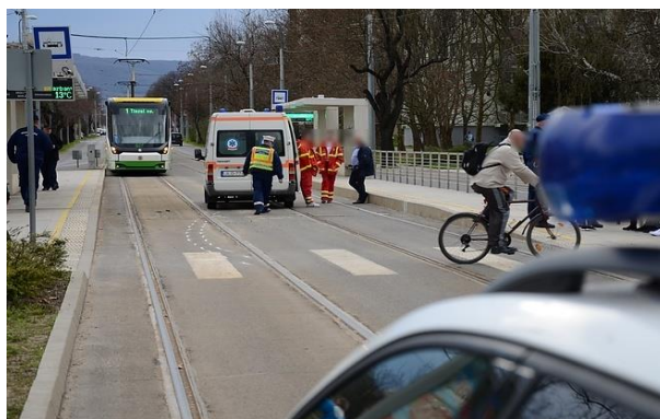
7. ábra. OMSZ mentő-gépkocsi gyalogos gázolása [9]