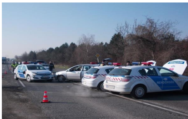
5. ábra. Autós üldözésben összetört rendőrségi járművek [7]

Budapesten 2016. március 23-án az V. kerületben ismét egy mentő-gépkocsi karambolozott ezúttal egy motorossal. A mentő a megkülönböztető jelzéseit használva haladt a Bajcsy Zsilinszky úton, amikor összeütközött a szabálytalan robogóssal. A motoros a záróvonal ellenére előzte a kocsisort, viszont a szemből érkező mentőautó elől már nem tudott visszatérni a sávjába. A balesetet kiváltó ok egyértelműen a robogós általi szabálytalan előzés volt. Feltételezhető, hogy a motoros figyelme az álló vagy araszoló autók közötti szlalomozásra koncentrált és későn tudatosult benne, hogy egy szirénázó mentő közeledik szemből. Nagyon valószínű, hogy a szabálytalan magatartás mellett itt is közrejátszott a figyelmetlenség a baleset bekövetkezésében.[8]