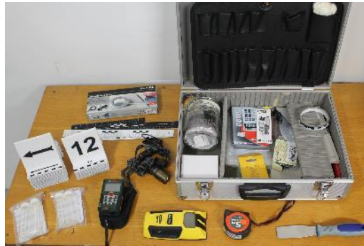
1. kép. A helyszíni szemle lefolytatásának eszközei 5

Abban az esetben, ha a valamilyen égésgyorsító használatára utalnak a nyomok, mintavételezésre kerül sor. A mintavételezés szigorú szabályokhoz kötött, pontosságot és szakszerűséget igénylő tevékenység. A BM OKF Katasztrófavédelmi Kutatóintézetben (Katasztrófavédelmi Oktatási Központ) lehetőség van az égésgyorsító anyagok vagy anyagmaradványok kimutatására a mintákból, kémiai analízissel.