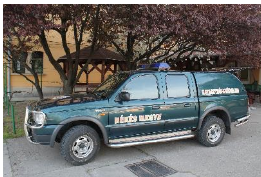
4. kép. Békés Megyei Katasztrófavédelmi Műveleti Szolgálat járműve 9