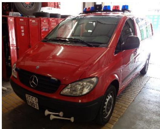
3. kép. Fővárosi Katasztrófavédelmi Műveleti Szolgálat járműve 8