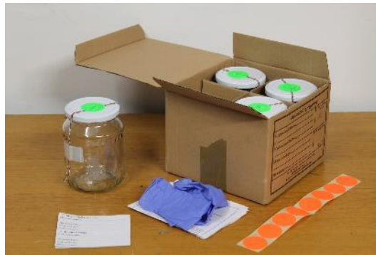
2. kép. Mintavételi egységcsomag 6

Abban az esetben, ha a valamilyen égésgyorsító használatára utalnak a nyomok, mintavételezésre kerül sor. A mintavételezés szigorú szabályokhoz kötött, pontosságot és szakszerűséget igénylő tevékenység. A BM OKF Katasztrófavédelmi Kutatóintézetben (Katasztrófavédelmi Oktatási Központ) lehetőség van az égésgyorsító anyagok vagy anyagmaradványok kimutatására a mintákból, kémiai analízissel.