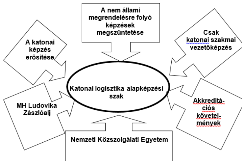
1. ábra. Az új tisztképzés környezete

Végül három-három alap- és mesterképzési szakra történt javaslat, amit utána el is fogadtak: Katonai vezető, Katonai üzemeltetés, Katonai logisztika alapképzési és Katonai vezető, Katonai üzemeltetés, Katonai műveleti logisztika mesterképzési szakok.