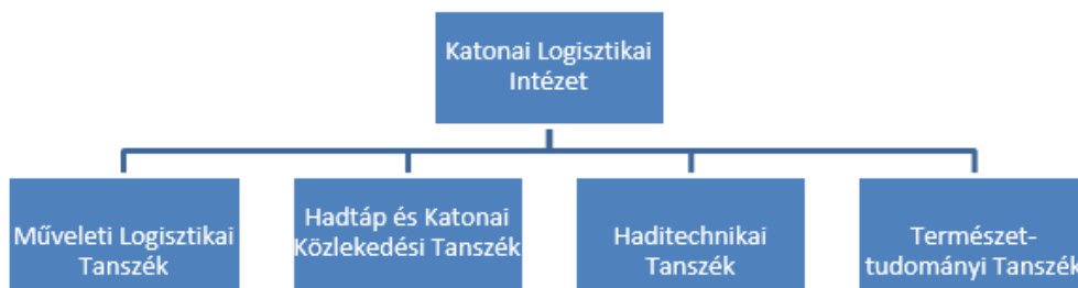
2. ábra. A Katonai Logisztikai Intézet szervezete

Az új egyetemen a katonai képzéseket a Hadtudományi és Honvédtisztképző Kar folytatja, amely számos egyéb szervezeti egységen kívül az alap- és mesterképzéseknek megfelelő három új intézetből áll. Ezzel a tisztképzésben létrejött egy olyan egyen szilárd szervezeti felépítés, ami teljes mértékben összhangban van az adott képzési portfólióval, biztosítja az adott szakok összehangolt, egységes vezetését és a folyamatos kapcsolattartást a Magyar Honvédség szakmai képzésért felelős vezetőivel. Az új struktúrában a Katonai Logisztikai Intézetben (továbbiakban KLI) a logisztikai képzéseket folytató oktatási egységek egy szervezetbe kerültek (2. számú ábra), továbbá a logisztikai képzés a többi területtel azonos vezetési szinten helyezkedik el.